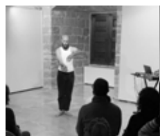
Fotogrames de l'acció I am (t)here d'Aurora Bauzà i Pere Jou.