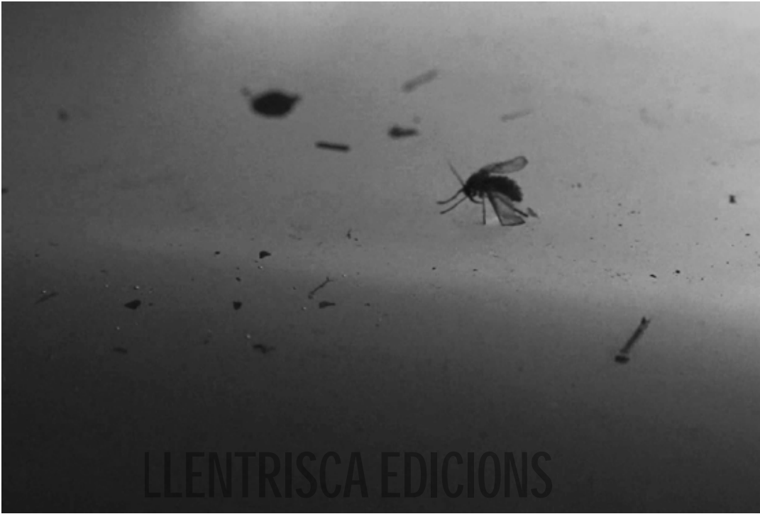
Fotograma del vídeo Mel boja de Joan Bennàssar.