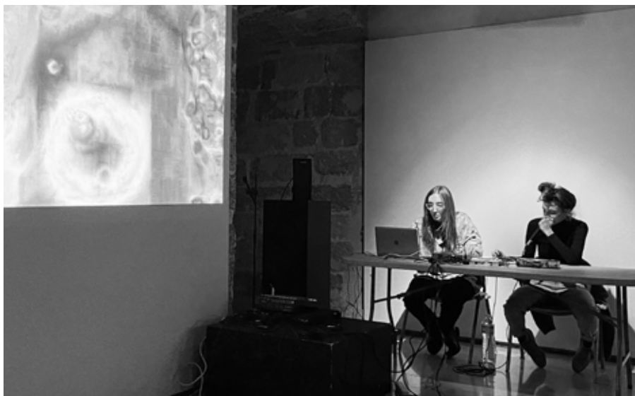
Avestruces presentant el seu projecte Huida constante de la cabeza en el sonido .