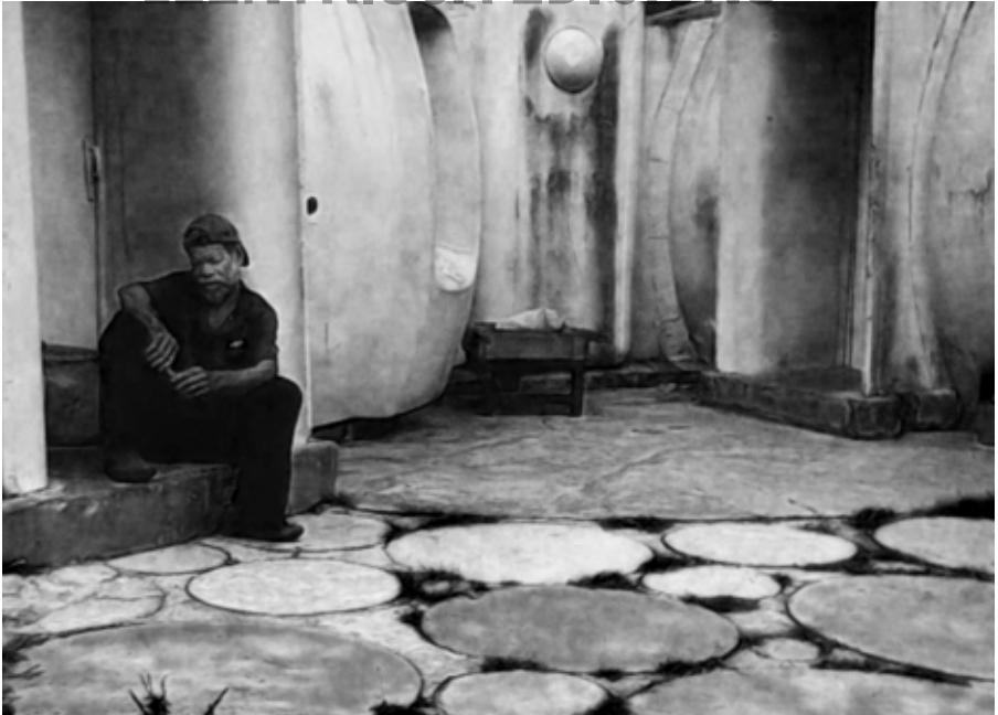
Fotogrames del vídeo Cabezas parlantes de Joan Bennàssar.